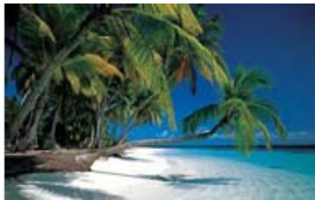
Abb. 2: Meer, Gebirge: 10.000 Ionen/ cm 3